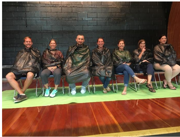
¡Nuestros valientes miembros del personal!